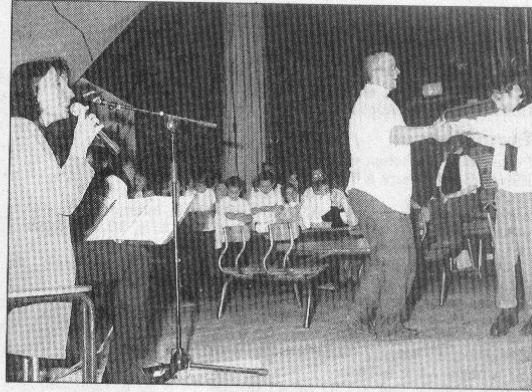
Le Petit Prince de la lune a trouvé des amis sur terre.